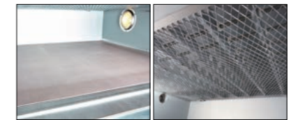
▶ 차별화된 스팀장치 ◀