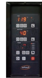
▶ 컨트롤러 ◀