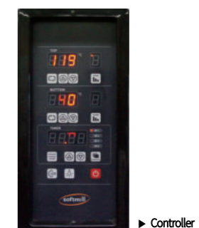
▶ Controller ◀