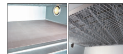
▶ Differentiated steam device ◀